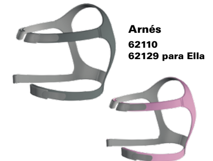
Arnés 62110 62129 para Ella