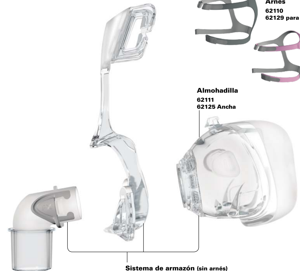
Almohadilla 62111 62125 Ancha