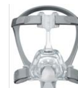
62118 Mirage FX Ancha