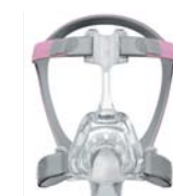
62128 Mirage FX para Ella