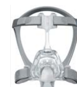
62103 Mirage FX